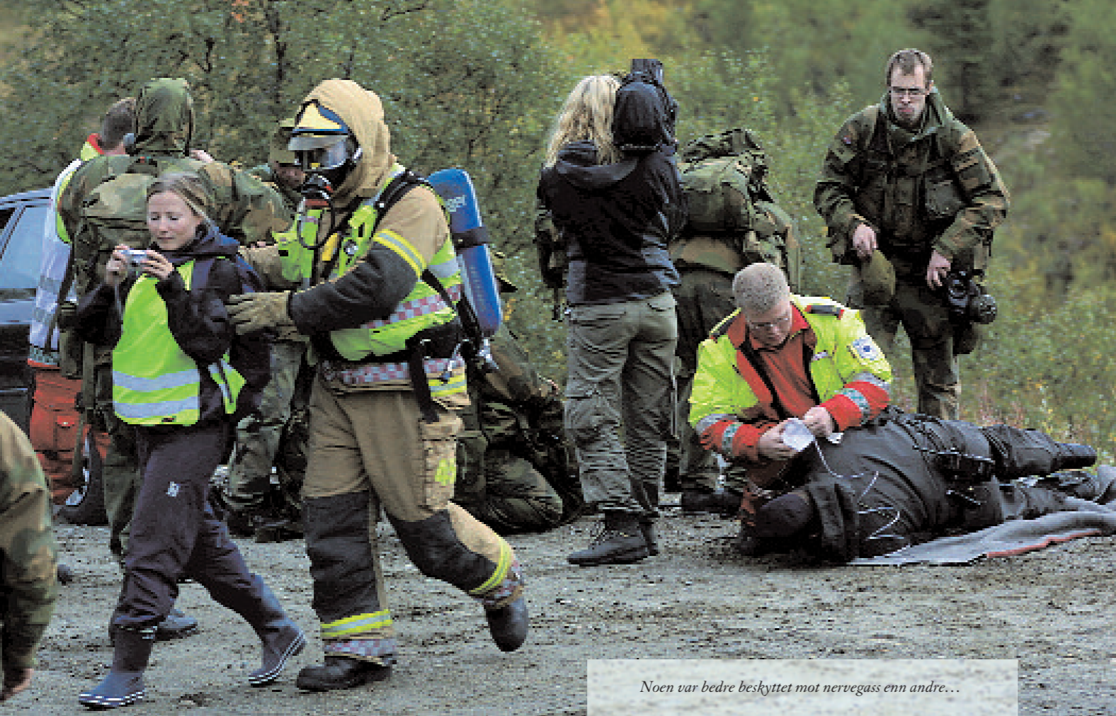
Noen var bedre beskyttet mot nervegass enn andre...

avansert behandling, stabilisering, gjentatte prioriteringer og tilslutt videre sending med luftstransport til sykehus i inn- og utland.