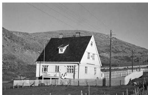
Figur 1 Kjøllefjord sykestue, 1936.

Fra de første sykestuene ble etablert i Finnmark i 1874 (2) går det en lang og kronglete vei frem til at Helse- og omsorgsdepartementet foreslår at kommunene skal få en lovfestet plikt til å gi tilbud om døgnopphold for pasienter med behov for øyeblikkelig hjelp (1). I sykestuene kunne distriktslegen observere og behandle pasienter som trengte innleggelse, i de tilfellene hvor sykehusinnleggelse i praksis var vanskelig å gjennomføre. De ivaretok et mangfold av funksjoner: akuttmedisinsk stabilisering, utredning og observasjon i forkant av sykehusinnleggelse, enkle behandlingsopphold og tidlig tilbakeføring fra sykehus. Tidligere gjorde distriktslegene mer enn vi kunne tenke oss i dag (2) (fig1). Distriktslege Knut Schrøder forteller hvordan han benyttet Kjøllefjord sykestue i Finnmark i 1936: «På dette halvår har jeg hatt 76 pasienter, 4 blindtarmoperasjoner, 4 – 5 brokkoperasjoner, en sterilisering, et par utskrapninger, flere tonsillektomier, et par fingeramputasjoner, og utført tallrike incisjoner. (...) Hittil har inngrepene gått uten en komplikasjon, ja så og si uten ergrelse eller engstelse. (...) For sykekassen er det en stor besparelse å ha pasientene her på sykestuen. For øyeblikkelig hjelp en utrolig lettelse for pasienten, for ikke å si det sterkere. Nærmeste sykehus, Vardø og Hammerfest, er 9 – 10 timers reise med hurtigruten, hvis det da passer med tiden» (2).