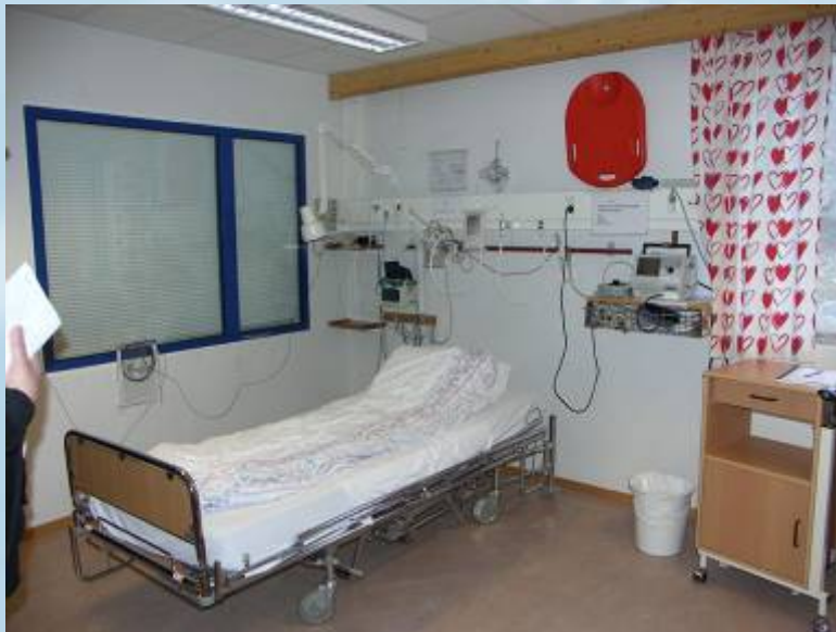
Sykestua i Båtsfjord

Oppfølging av den enkelte student opprettholdes med moderne teleteknologi mens de er utplassert